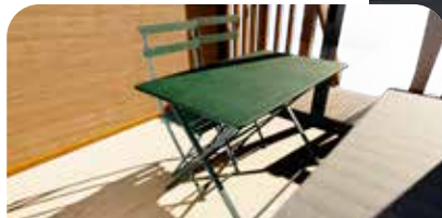
TABLE + 2 CHAISES FERMOB

Le séjour de la Créaventure peut accueillir un lit d'appoint de 120 cm x 190 cm.